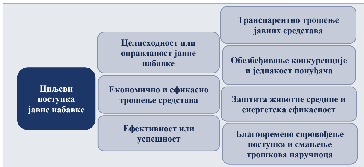
Слика бр. 1: Приказ циљева поступка јавне набавке 27

Наручилац је дужан да посебним актом ближе уреди начин планирања, спровођења поступка јавне набавке и праћење извршења уговора о јавној набавци (начин комуникације, правила, обавезе и одговорности лица и организационих јединица), као и начин планирања и спровођења набавки на које се закон не примењује. 28 Овим актом, који је сваки наручилац у обавези да донесе, уређују се циљеви поступка јавне набавке и повезане процедуре унутар сваког наручиоца, као и даља конкретизација начела јавне набавке утврђених у ЗЈН. 29