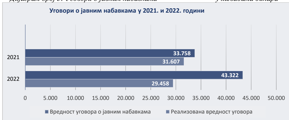
Дијаграм број 3: Уговори о јавним набавкама у хиљадама динара

Дом здравља је у 2021. години реализовао 94% уговорене вредности закључених уговора о јавним набавкама, а у 2022. години 68% уговорене вредности закључених уговора о јавним набавкама. 67