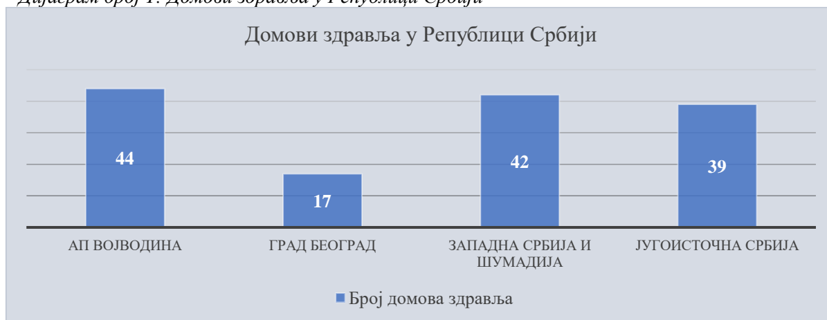
Дијаграм број 1: Домови здравља у Републици Србији 50

Од укупног броја домова здравља око 43% распоређено је на подручју Аутономне покрајине Војводине и Града Београда, односно 57% на подручју Западне и Југоисточне Србије.