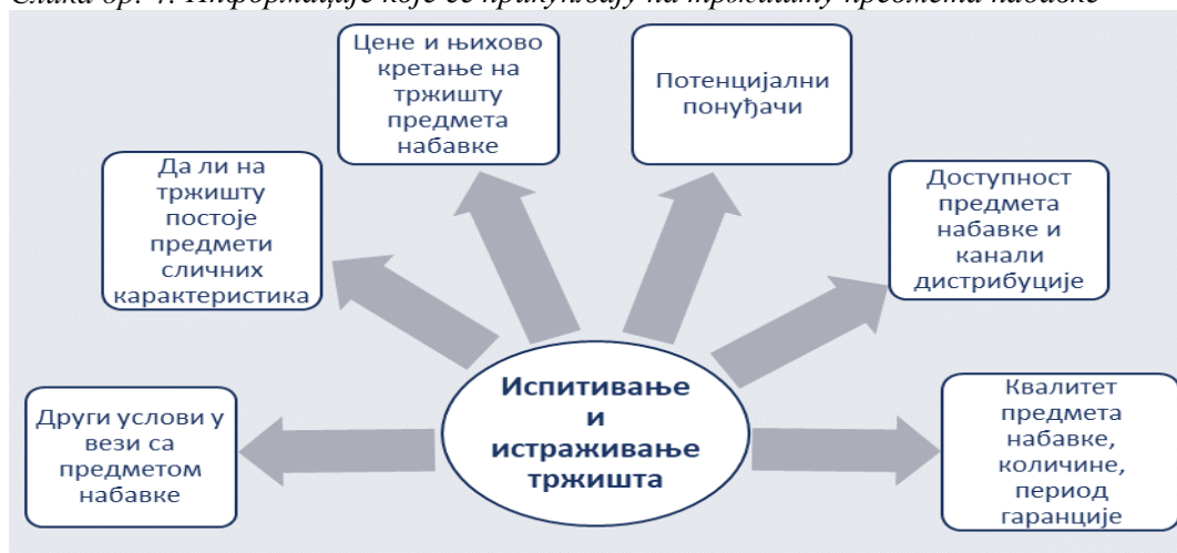
Слика бр. 4: Информације које се прикупљају на тржишту предмета набавке

Дом здравља је спроводио радње на истраживању тржишта предмета набавке путем интернета или позивањем потенцијалних понуђача да доставе цене одређених добара и услуга. У претходном периоду наведене радње нису евидентирани и документовани и није сачињаван Записник о спроведеним активностима. 78